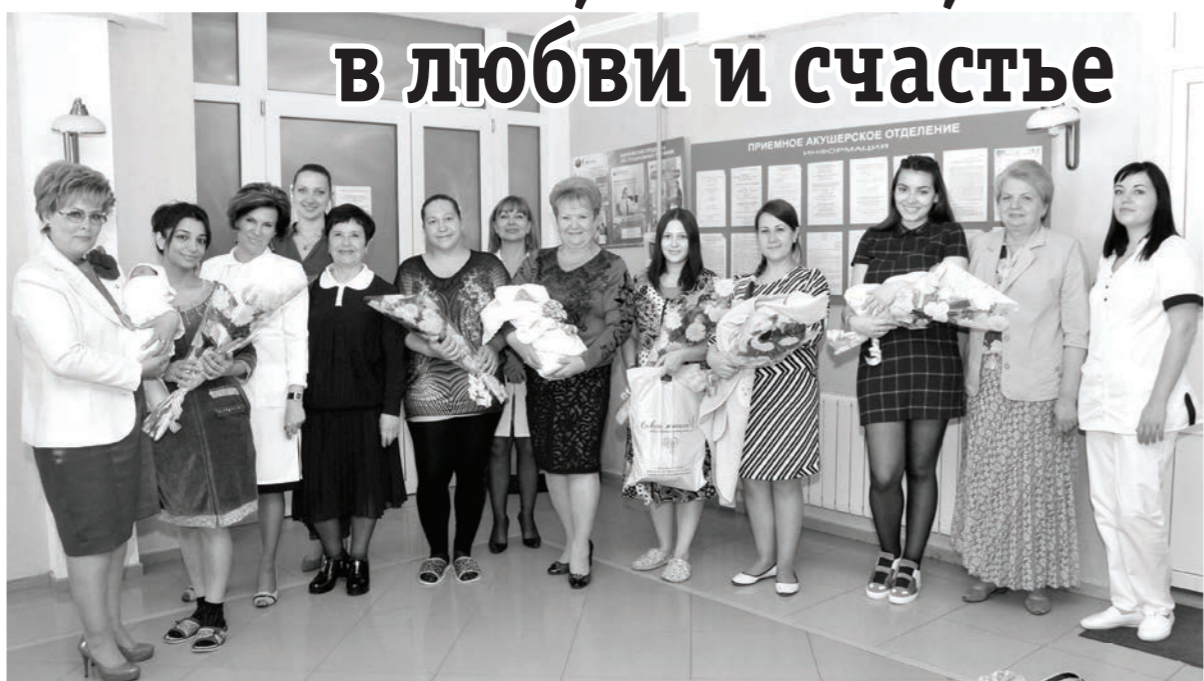
Рождение ребенка — долгожданное чудо и истинное счастье для родителей. А когда оно совпадает с таким великим праздником, как День Победы, это двойная радость.

9 Мая — это день национальной гордости и славы нашей страны. Он объединяет многие поколения. Сколько бы лет ни прошло — это всегда будет День Победы.