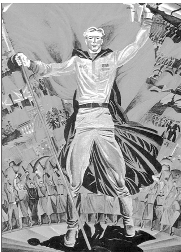
ДЕНЬ ПОБЕДЫ ВЫСТАВКА ПЛАКАТА