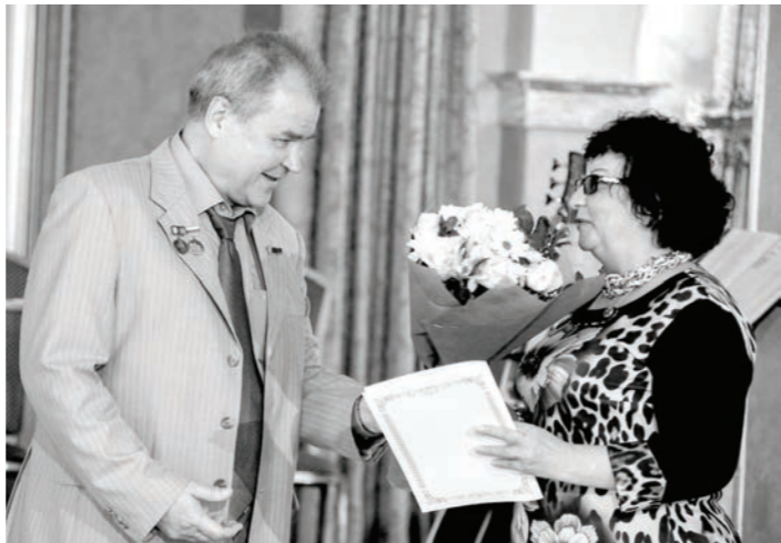
— Цените родной край, и он вам ответит взаимностью. Желаю вам неиссякаемого творческого вдохновения и надеюсь на дальнейшее продуктивное сотрудничество.

ТРЕТИЙ раз в краевом центре прошел торжественный прием, посвященный Дню средств массовой информации Ставропольского края.