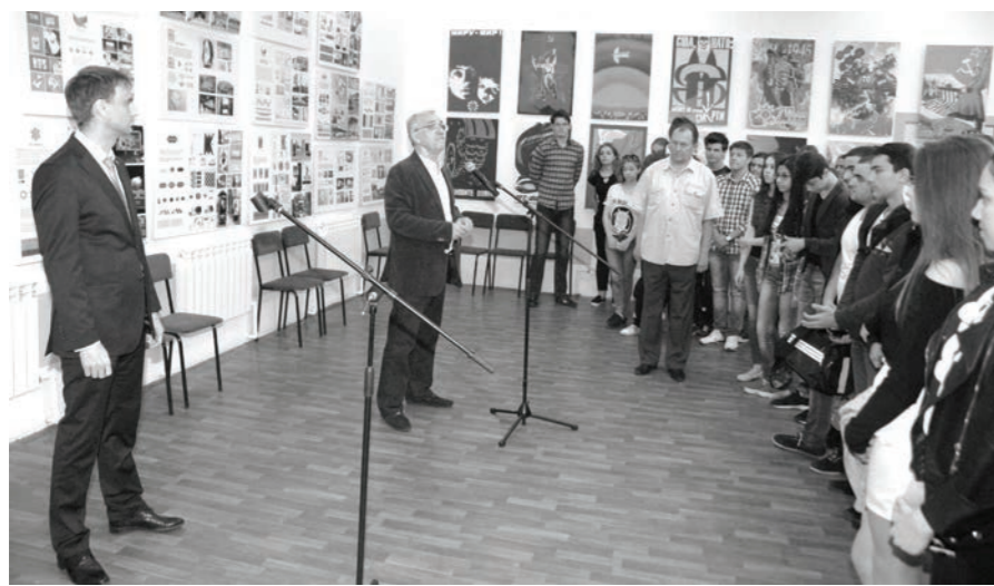
Уникальная выставка-конкурс проектов брендов городов-курортов Кавказских Минеральных Вод состоялась в минувшую среду в Пятигорске в Ставропольском краевом училище дизайна.