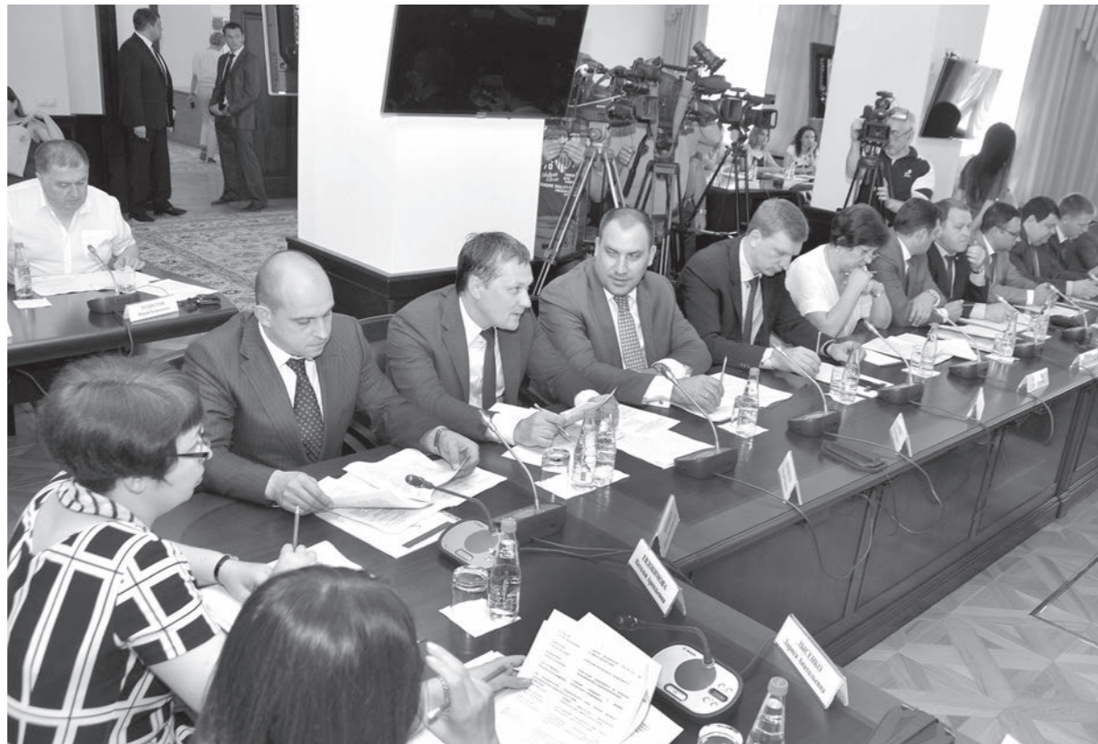
➤ (Окончание. Начало на 1-й стр.)

« К СОЖАЛЕНИЮ, сегодняшняя реальность говорит нам о накапливающихся экологических проблемах в регионе. Загрязнение водных ресурсов, атмосферного воздуха, деградация природных ландшафтов, увеличение антропогенной нагрузки, и, как следствие, эти проблемы в совокупности являются одним из самых интересных и перспективных направлений для России. Многие из них требуют достаточно большие суммы денег в тех местах, где отдыхают, что вносит значительный вклад в экономическое развитие страны».