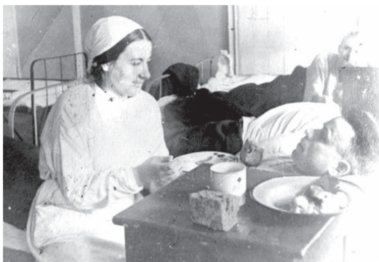
Лечение раненых в госпиталях на Кавказских Минеральных Водах

Свыше 25 тысяч воинов послал на фронт наш город. Они сражались на всех фронтах от Баренцева до Черного моря. Тысячи наших земляков награждены орденами и медалями. Около 12 тысяч пятигорчан погибли в боях за свободу и независимость нашей Родины.