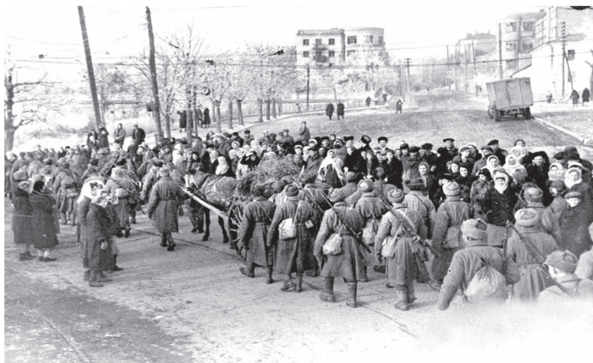
Части Красной Армии входят в освобожденный Пятигорск Январь 1943 года

В БЕДСТВЕННОМ положении, с разграбленным медицинским оборудованием оказались все медучреждения, где должны были снова развернуть работу эвакогоспитали. Фронт требовал наладить работу госпиталей для раненых. И тогда оставшиеся в живых и вернувшиеся из эвакуации жители Пятигорска приступили к расчистке завалов, ремонту помещений, сбору вещей для раненых. Работая в невероятно трудных условиях, стремясь в самые короткие сроки восстановить утраченное, медики начали при-