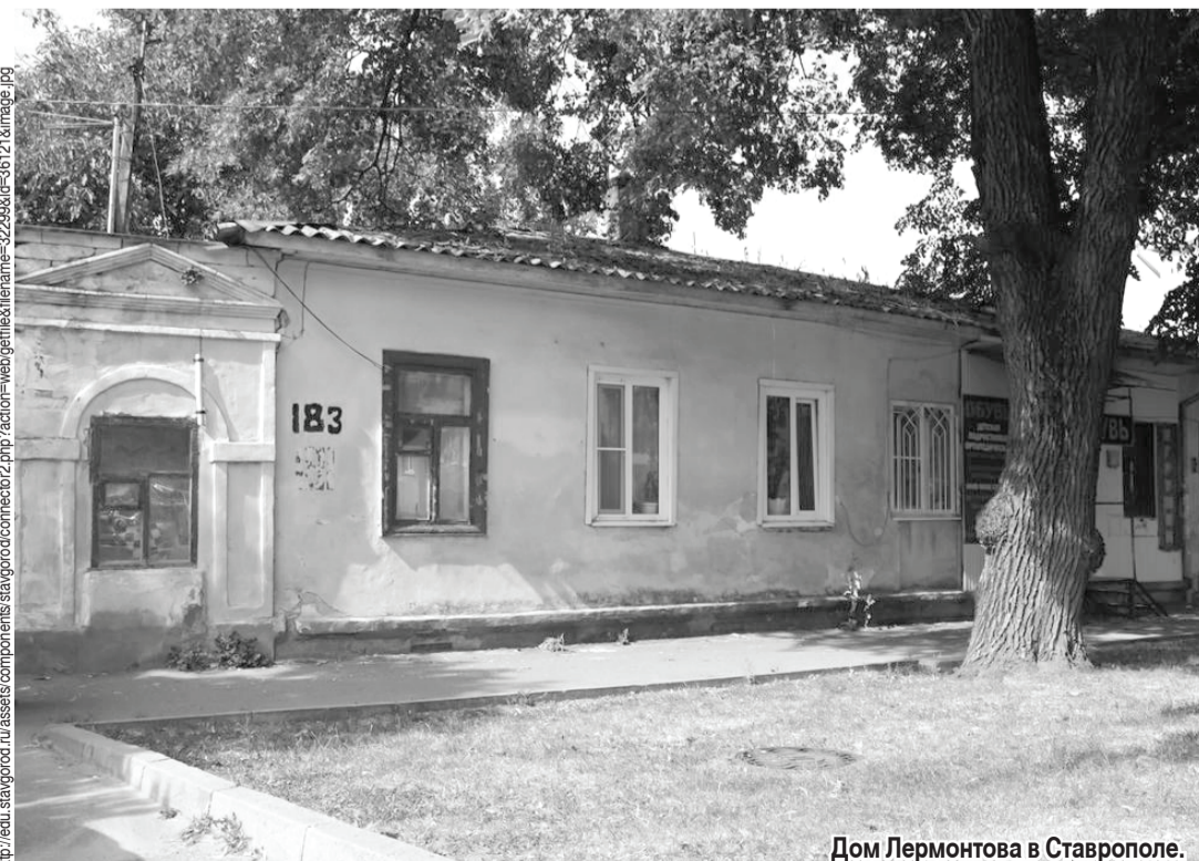
Дом Лермонтова в Ставрополе.