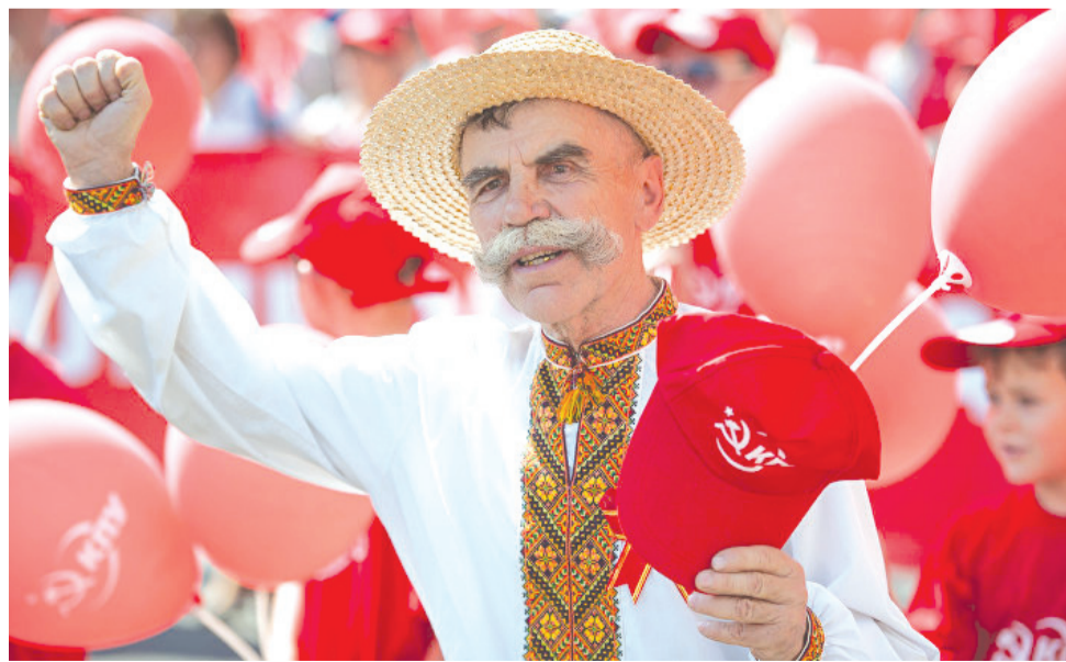
Полосу подготовил Сергей ДРОКИН по материалам зарубежной прессы.

Опрос был проведен с 9 по 14 сентября 2016 года во всех регионах Украины. В исследовании приняли участие 2018 респондентов в 118 населенных пунктах, выборка опроса строилась как многоступенчатая, случайная с квотным отбором респондентов на последнем этапе. Погрешность выборки (без учета дизайн-эффекта) не превышает 2,3% с вероятностью 0,95 .