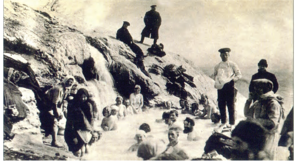
«Бесстыжие ванны», XIX в..

Показан углекислый сероводород при кожных