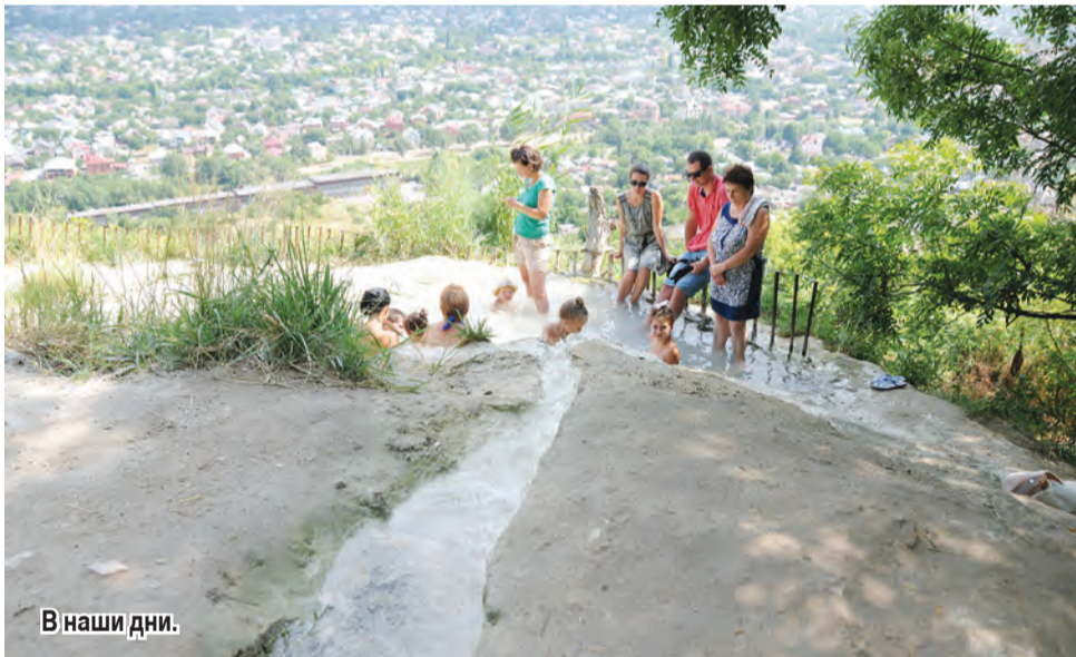
В наши дни.

зались занятыми, возле каждой периодически накапливалась очередь! Кто-то окунался полностью, с головой, другие опускали в воду ноги, третьи погружались по грудь. Возраст принимающих ванны был абсолютно разным. Нами замечены и дети, и молодежь, и пенсионеры.