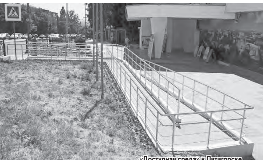
«Доступная среда» в Пятигорске.

Проблема людей с ограниченными возможностями здоровья, их адаптации в обществе, взаимодействия и отношения этого общества к его так называемому меньшинству является сегодня актуальной и очень серьезной. В России их число составляет свыше 12 млн человек. Но каждый год эта цифра увеличивается.