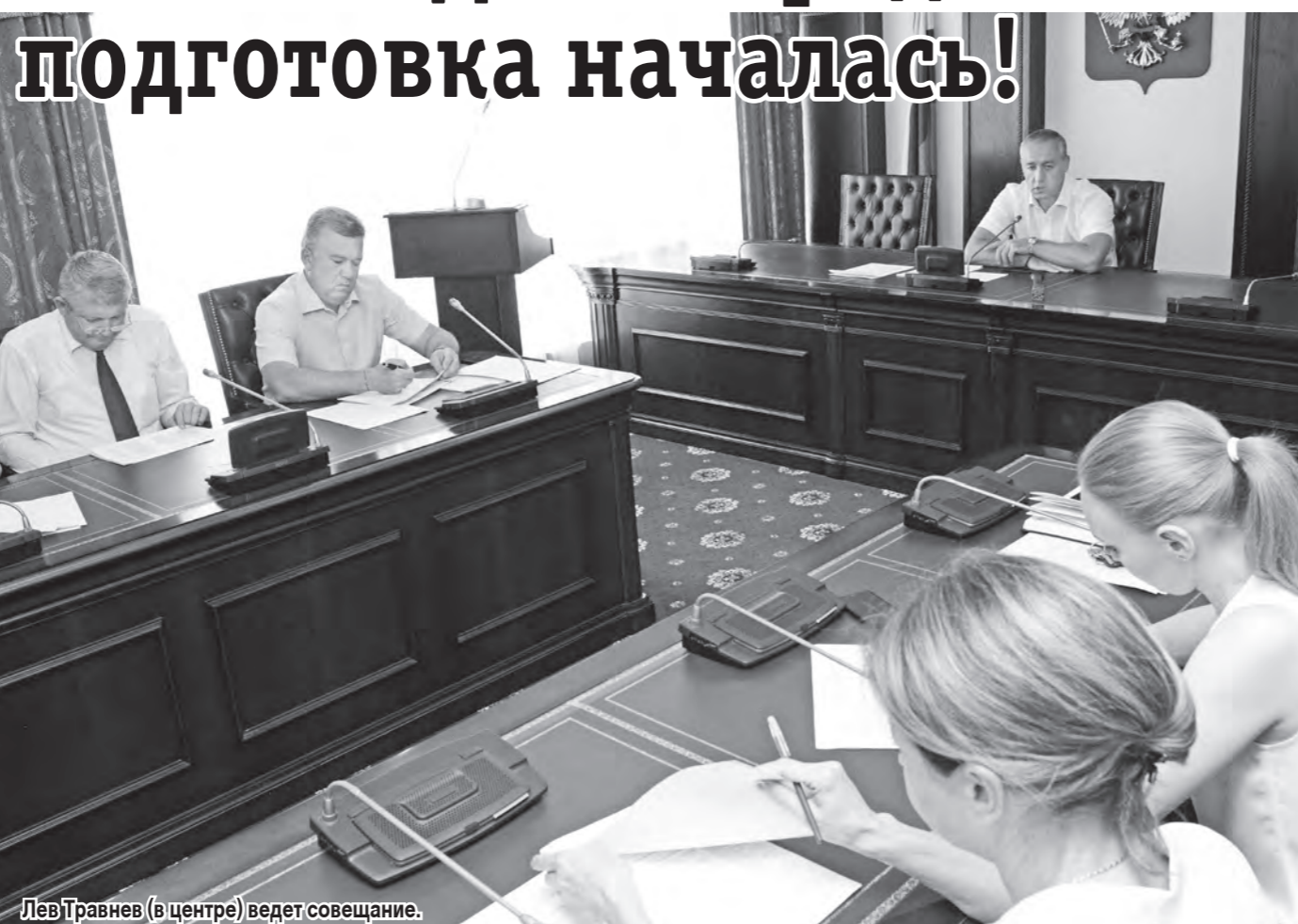
Лев Травнев (в центре) ведет совещание.

Чуть больше месяца осталось до Дня города. 9 сентября Пятигорск отметит свою 237 годовщину. Подготовка к важному событию уже идет во всю. Так, на днях под председательством главы столицы СКФО Льва Травнева прошло заседание организационного комитета по проведению праздника.