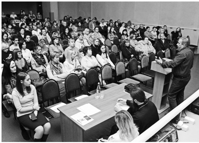
Первое в новом учебном году городское заседание Университета педагогических знаний для родителей традиционно проходило во Дворце детского творчества.

Послушать специалистов, компетентных в вопросах детской психологии, пришли в основном родители школьников. И неслучайно, так как в этот раз на собрании говорили о духовно-нравственном воспитании младшего поколения и особенностях подросткового и полового развития детей.