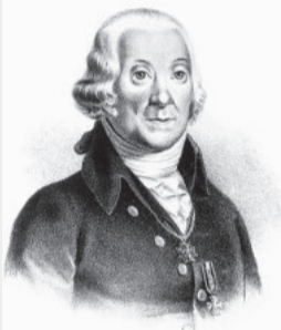
П. С. Паллас.