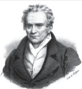
И. А. Гюльденштедт.

Прогуливаясь по курортному району старого Пятигорска, мы можем увидеть и узнать много интересного о прошлом нашего города. Обычно это касается знаменитых гостей — писателей, поэтов, музыкантов, чьи имена оказались связанными с теми или иными памятными местами. Но, думается, не менее интересно пройти по тем же самым местам, обратив внимание на людей, чьими стараниями создавался, развивался, совершенствовался пятигорский курорт. Следы их деятельности мы увидим без труда, поскольку многие памятники истории, культуры, архитектуры, которыми славится Пятигорск, являются и своеобразными памятниками первопроходцам курорта.