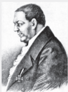
Ф. П. Гааз.