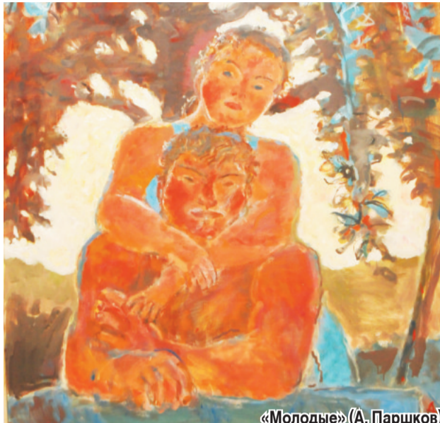
«Молодые» (А. Паршков)

Необычное соседство различных, иногда диаметрально противоположных, направлений живописи представлено на художественной выставке, открывшейся в минувшие выходные в Государственном музее-заповеднике М. Ю. Лермонтова.