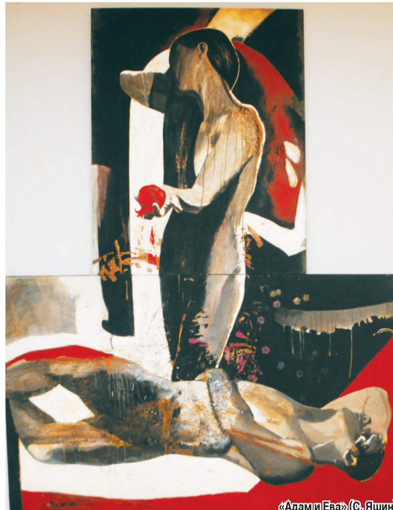
«Адам и Ева» (С. Яшин)

Выставочный проект «Встреча друзей» впервые экспонировался в 1993 году в Центральном доме художников в Москве, а в 2012 году — в Краснодарском краевом выставочном зале изобразительных искусств. В феврале он был представлен в Северо-Кавказском филиале Государственного музея искусства народов Востока (г. Майкоп). В разное время в проекте принимали участие шесть художников Юга России.