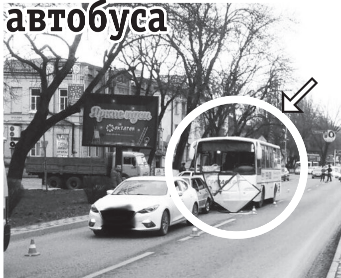
Полосу подготовила Татьяна ШИШИМЕР.

В Пятигорске произошло тройное ДТП с участием пассажирского автобуса.