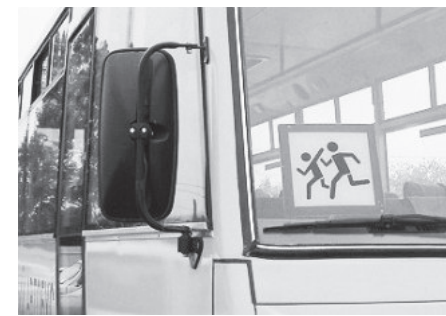
Полосу подготовила Татьяна ШИШИМЕР.

Судьбу документа в последующем можно отследить, увидеть резолюцию ответственных сотрудников и комментарии по выявленным нарушениям, что очень удобно. Если гражданин указал в форме свою электронную почту, то все сведения будут приходить ему на нее автоматически.