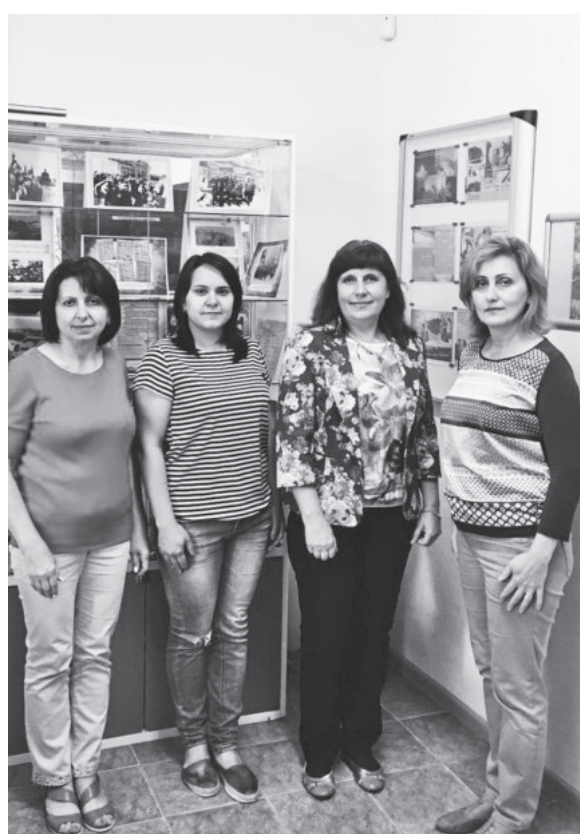
Сотрудники архивного отдела администрации Пятигорска.

В соответствии с Указом Президента Российской Федерации от 10.07.2017 года № 314 в 2018 году проводятся мероприятия, посвященные празднованию 100-летия государственной архивной службы России.