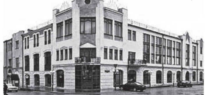
Современный вид здания бывшей Казенной гостиницы.

Позднее, в начале XX столетия на месте сломанного дома Конради выросло великолепное здание Казенной гостиницы, отличавшейся высоким уровнем комфорта.