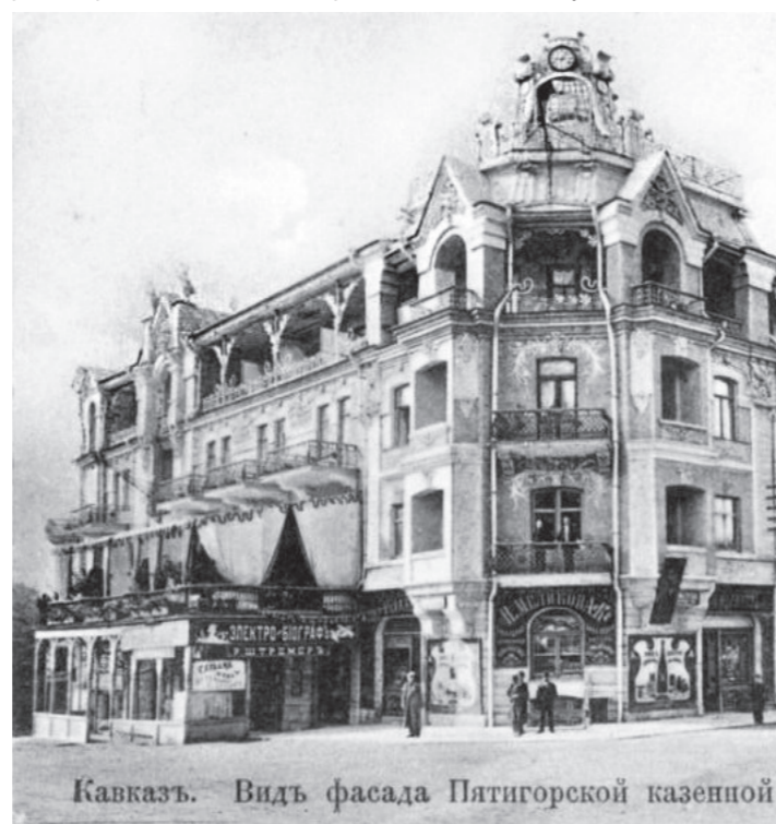
Кавказь. Видь фасада Пятигорской казенной гостиницы.