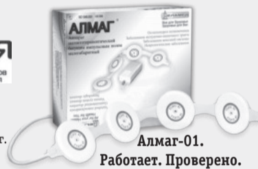
Алмаг-01. Работает. Проверено.

*Срок проведения акции: с 1 по 31 июля 2018 г. Возврат Алмага-01 производится с 1 по 30 августа 2018 г. При условии проведения одного курса процедур (21 день) и предоставления чека. Подробности по бесплатному телефону компании Еламед: 8-800-200-01-13.