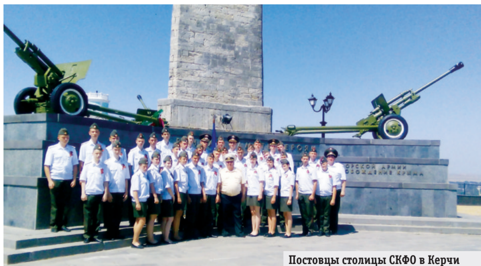
Постовцы столицы СКФО в Керчи

большая семья. Абсолютно все места, что мы посетили, были знаковыми в истории нашей страны. Но одно дело читать об этом, другое — увидеть своим глазами. Так намного интереснее. Спасибо большое за эту поездку!»