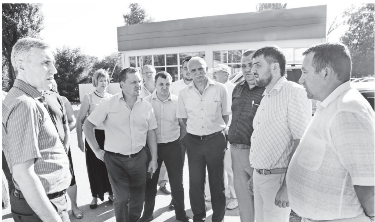
Глава Пятигорска Андрей СКРИПНИК провел выездное совещание с руководителями территориальных служб города и других структурных подразделений администрации столицы СКФО. Местом встречи на этот раз стала станция Константиновская.