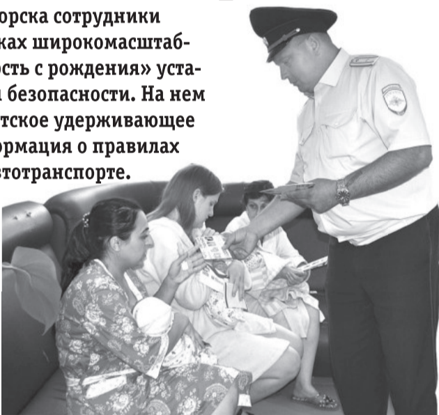
Акция была направлена на привлечение внимания общественности к проблеме роста детской аварийности в автотранспорте, предупреждение ДТП с участием молодых матерей.