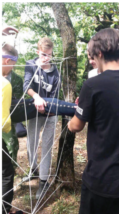
Полосу подготовила Дарья ШЕРСТЮКОВА.

Одним из самых легких испытаний ребята признали конкурс «Вертикальная паутина». Надо было пролезть на другую сторону через канатные ячейки, не касаясь веревок. В общем, вот так неординарно молодежь провела свой осенний день, а заодно укрепила лидерские качества и навыки работы в команде.