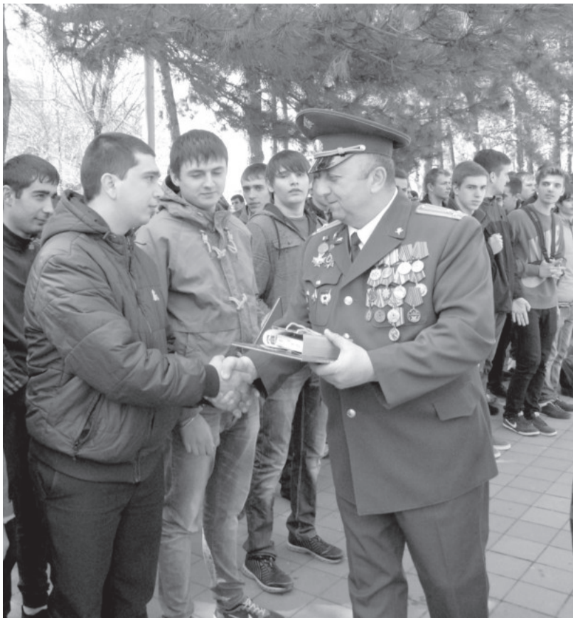
День призывника — городская традиция.

1 октября стартовала осенняя призывная кампания. Завтрашние солдаты отправились в военкоматы, чтобы пройти медкомиссию. Волнуются родители. Переживают по поводу предстоящей разлуки невесты. А сами ребята, рожденные в нулевых и ранее, в большинстве полны решимости служить. В чем убедились и наши корреспонденты, побывавшие в Военном комиссариате по городам Пятигорску, Лермонтову, Эссентукам и Кисловодску.