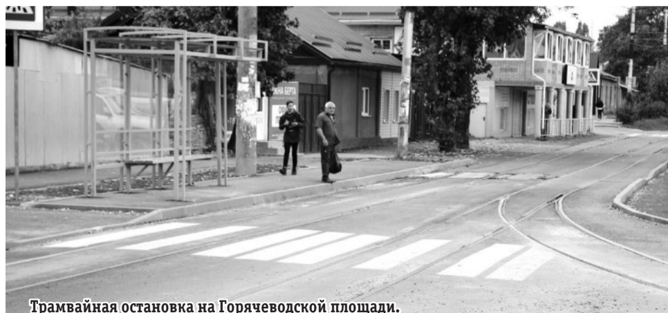
Трамвайная остановка на Горячеводской площади.