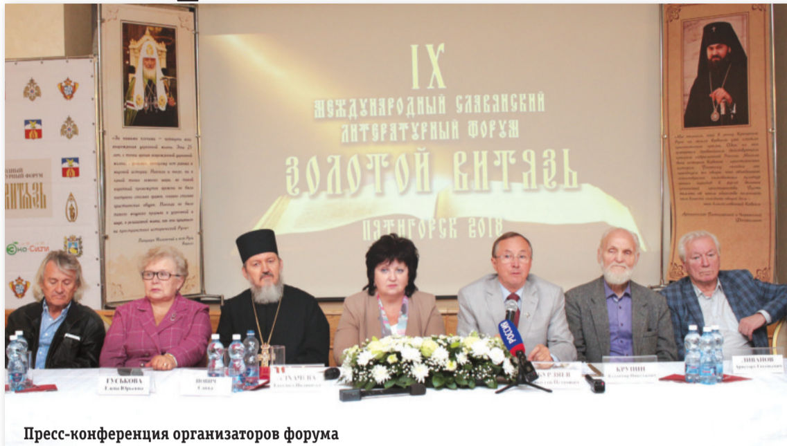
Пресс-конференция организаторов форума