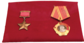
Медаль «Золотая Звезда» — знак отличия лица, удостоенного звания Героя Советского Союза «Орденом Ленина» — высший орден СССР, вручался одновременно с медалью. Звание Героя Советского Союза установлено Постановлением ЦИК СССР в 1934 г., дополнительный знак отличия для Героя Советского Союза — медаль «Золотая Звезда» учреждена Указом Президиума Верховного Совета СССР в 1939 г.