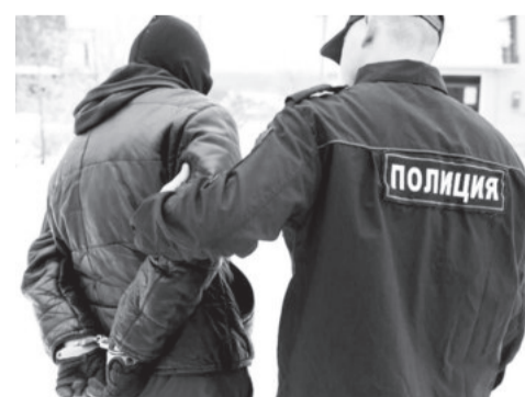
Полосу подготовила Татьяна ШИШИМЕР.

По всем фактам следственным отделом ОМВД России по Пятигорску возбуждены уголовные дела по признакам преступления, предусмотренного частью 2 и частью 3 статьи 162 Уголовного кодекса Российской Федерации (разбой). По ходатайству следователя судом в отношении гражданина избрана мера пресечения в виде заключения под стражу.