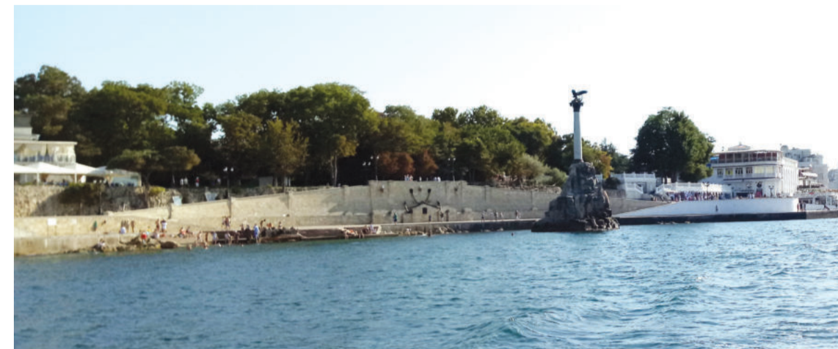
АВТОР> АННА КОБЗАРЬ

СЕГОДНЯ ОДНО ЛИШЬ УПОМИНАНИЕ ЭТОГО ПОЛУОСТРОВА ВЫЗЫВАЕТ БУРЮ САМЫХ РАЗНООБРАЗНЫХ ЭМОЦИЙ. ТЕМ НЕ МЕНЕЕ, У БОЛЬШИНСТВА ИЗ НАС С КРЫМОМ СВЯЗАНЫ ТЕПЛЫЕ ВОСПОМИНАНИЯ, ПРИЯТНЫЕ АССОЦИИ И ДАЖЕ СЕМЕЙНЫЕ ИСТОРИИ. А ПОТОМУ СОВЕРШИТЬ ПУТЕШЕСТВИЕ ПО КРЫМСКОМУ ПОБЕРЕЖЬЮ — НЕ ПРОСТО УДАЧНАЯ ИДЕЯ, А БОЛЬШОЕ СОБЫТИЕ, НАСТОЯЩЕЕ ПРИКЛЮЧЕНИЕ, ПОЛНОЕ СЮРПРИЗОВ И НЕОЖИДАННЫХ ОТКРЫТИЙ, КОТОРЫМИ МНЕ ХОЧЕТСЯ ПОДЕЛИТЬСЯ.