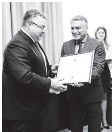
В рамках совещания состоялась церемония награждения организаторов форума «Машук-2019».

Впервые в истории форума были привлечены более 30 работодателей, организована стажировка на предприятиях. Состоялись встречи с организаторами и победителями проектов «Россия — страна возможностей», «Лидеры России».