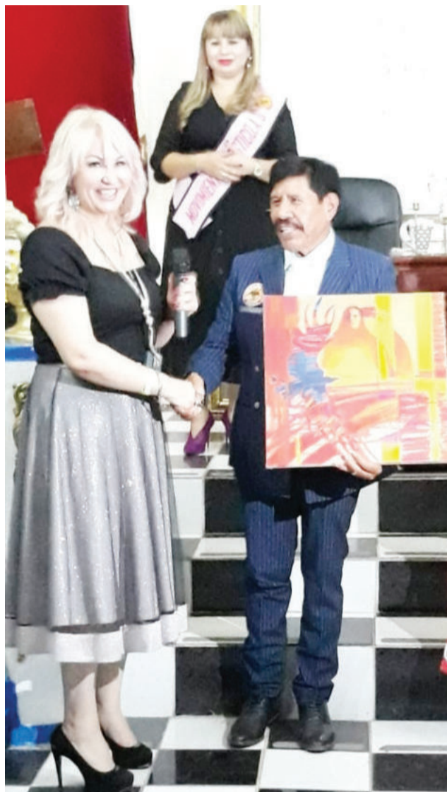
Автор > ТАТЬЯНА ШИШИМЕР

Искусство, рожденное на просторах Пятигорска, вышло за границы города-курорта и отправилось покорять другие континенты. В Мексике прошел международный фестиваль майя и науатль «Кин Тонатю», организованный Гностическим центром по изучению культуры и антропологии Мексики совместно с ЮНЕСКО и Всемирным философским форумом. На нем были представлены работы художников столицы СКФО.