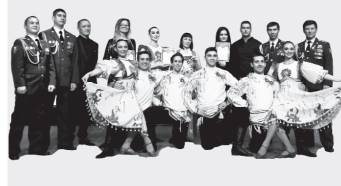
Подготовил Иннокентий СМОЛИН.

За подаренные эмоции и отличное настроение зрители отблагодарили артистов продолжительными аплодисментами. В завершение мероприятия творческий коллектив получил почетные грамоты от администрации санатория «Машук».