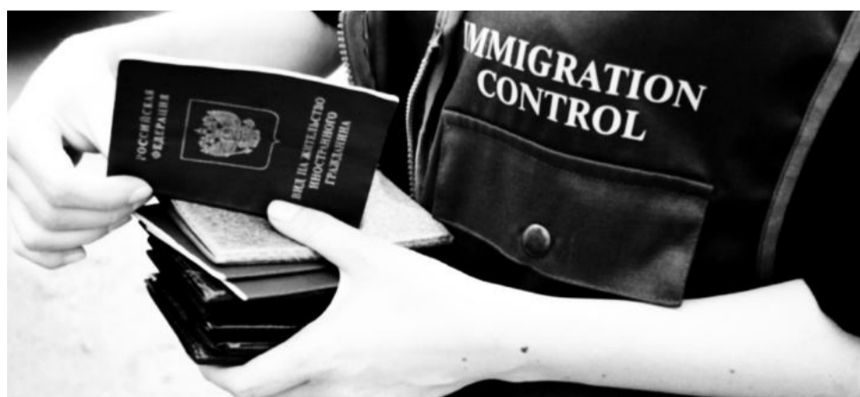
Полосу подготовила Татьяна Шишимир

Полиция Ставрополя предупреждает об ответственности за подобные преступления. Если вам известны аналогичные факты, незамедлительно сообщите об этом в органы внутренних дел по телефону 02, или 102 (с мобильного телефона).