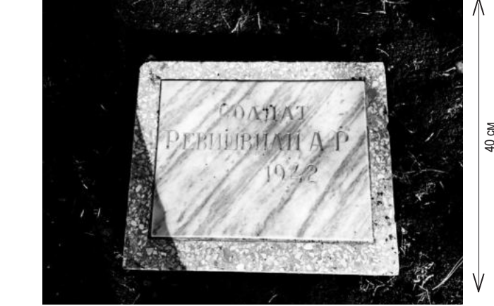
Размер мемориальной доски 30x40 см. Размер мраморного основания 50x40 см.

Эскиз 118 мемориальных досок, подлежащих установке по адресу: город Пятигорск, Мемориал Воинского кладбища