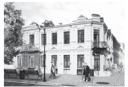
Полосу подготовила Татьяна Шишимер