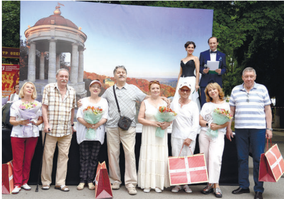
Автор > Наталья Тарасова

В МНОГОНАЦИОНАЛЬНОМ ПЯТИГОРСКЕ ТРАДИЦИОННЫЕ ЦЕННОСТИ В ПРИОРИТЕТЕ. И ДНЮ СЕМЬИ, ЛЮБВИ И ВЕРНОСТИ В НАШЕМ ГОРОДЕ ПОСВЯТИЛИ ЦЕЛЫЙ РЯД МЕРОПРИЯТИЙ.