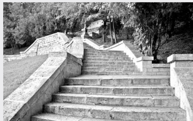
Лестница Павла Еськова в наши дни. Фото 2017 г.

Свой день рождения лестница встречает реконструкцией. Уже устроено новое покрытие на площадках между лестничными пролетами. На территории от театра оперетты до самой лестницы сооружается фонтан. Планируется устроить архитектурную подсветку гrotтов, самой лестницы и ее нижней площадки. А также будут устроены клумбы, которые повторят рисунок фонтана. На одной из площадок предполагают установить памятник Емануэлю, благодаря которому появились Елизаветинский цветник, Елизаветинский сад, беседка «Золова арфа», гrot Лермонтова, первая деревянная Елизаветинская галерея.