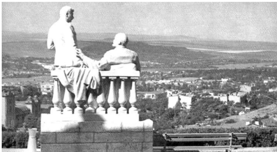
Скульптура «Ленин и Сталин» перед Академической галереей. Начало 1950-х годов