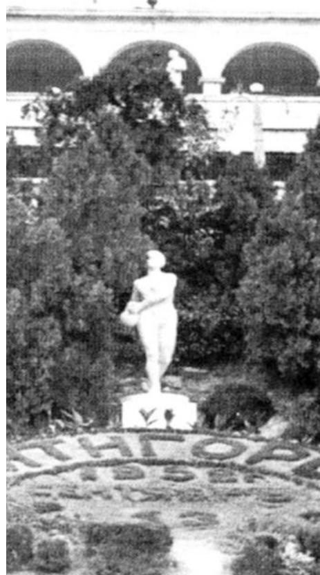
Скульптура спортсменки и цветочный календарь. 1952 г.