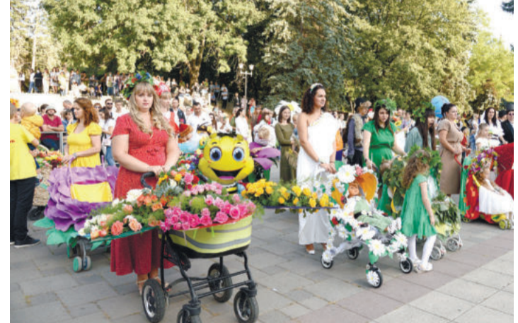
Автор: Татьяна Шишимир

Праздничное шоу «Букет родному городу» продолжило череду мероприятий, посвященных дню рождения Пятигорска.