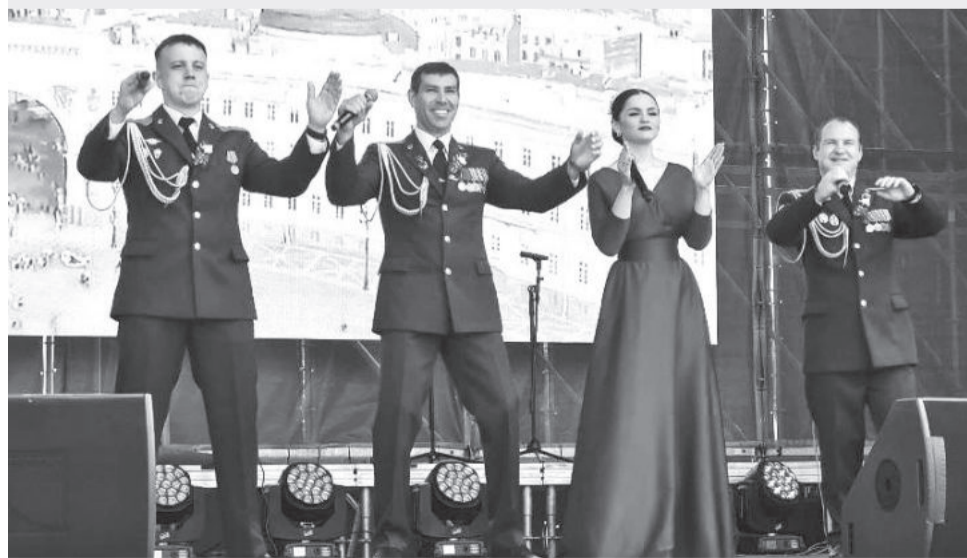
Полосу подготовил Иннокентий Смолин

Был в программе и праздничный концерт ведомственных творческих коллективов: Образцово-показательного оркестра войск национальной гвардии Российской Федерации (Москва), Военного оркестра Северо-Кавказского округа Росгвардии и ансамбля песни и пляски СКО войск национальной гвардии РФ.