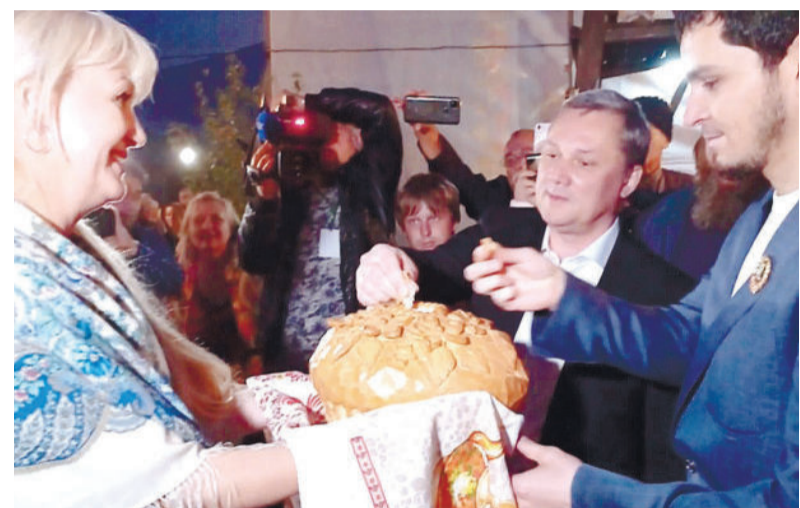
Автор: Анна Кобзарь

Колоритный и самобытный Пятигорск — яркий, как платок казачки, и ритмичный, как кавказский барабан. Встречал гостей на своих подворьях, которые украсили центральную аллею парка Победы. Здесь дружная многонациональная семья окружной столицы знакома всех желающих с богатством и разнообразием культур и традиций нашей благословенной земли в рамках фестиваля «Хоровод наций».