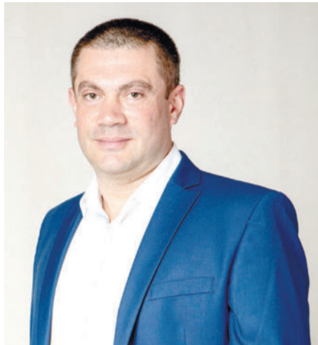
Автор > Татьяна Шишимер

Александр Аветян рассказал, что пункт временного размещения рассчитан на 170 мест. При размещении граждан для них проводится медицинское обследование. С учетом выявленных заболеваний оказывается помощь, организовывается специализированное питание.