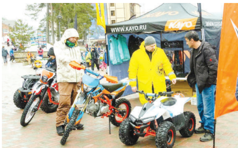
ООО «Роллинг Медиа». ОГРН 104779644300. Реклама.

Отдельно стоит отметить, что Кавминводы идеально подходят для данного вида отдыха. Прекрасные места, леса, поля, холмы. Конечно, при условии соблюдения всех правил,