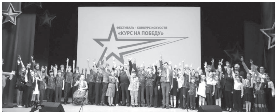
Автор > Татьяна Шишимер

Проникновенные строки стихов из уст взрослых и детей, трогательные строчки из песен — и все это не о прошлом, а о настоящем. Истории о героизме, подвигах российских солдат, о самоотверженности мирного населения нашли свое отражение в современном творчестве — итоги первого регионального фестиваля-конкурса искусств «Курс на Победу!» подвели в Пятигорске.