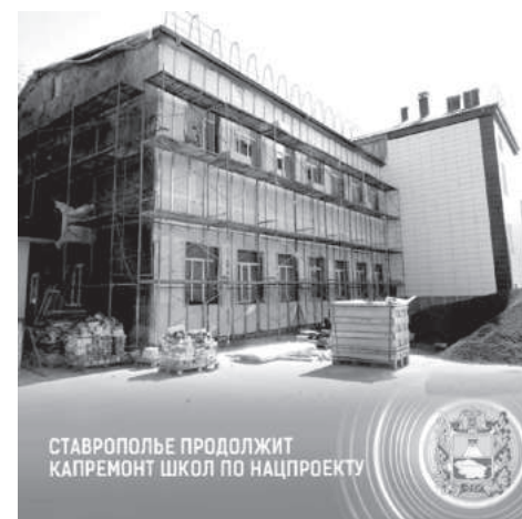
СТАВРОПОЛЬЕ ПРОДОЛЖИТ КАПРЕМОТ ШКОЛ ПО НАЦПРОЕКТУ